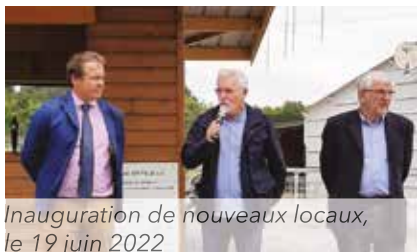
Inauguration de nouveaux locaux, le 19 juin 2022

Nous ne pourrions poursuivre sans évoquer le courage et l'investissement d'hommes et de femmes qui, depuis le début de cette histoire, ont toujours voulu et su partager