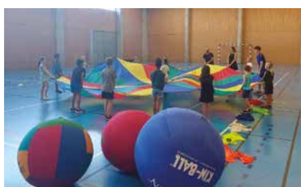
15 JUILLET : PASSAGE DE LA CARAVANE DU SPORT