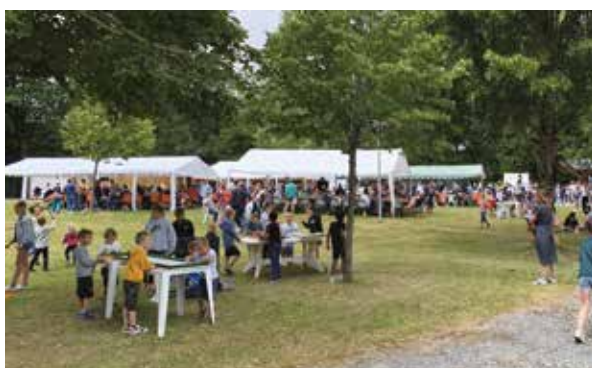
26 JUIN : FÊTE DE L'ÉCOLE JULES FERRY