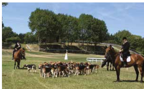
14 JUILLET: PRÉSENTATION DE VÉNERIE