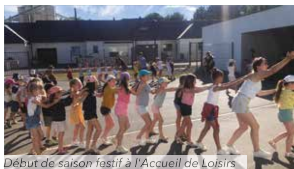
Début de saison festif à l'Accueil de Loisirs