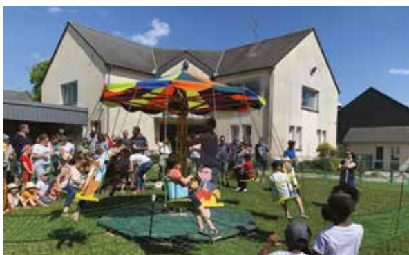
11 JUIN : KERMESSE DE L'ÉCOLE NOTRE-DAME