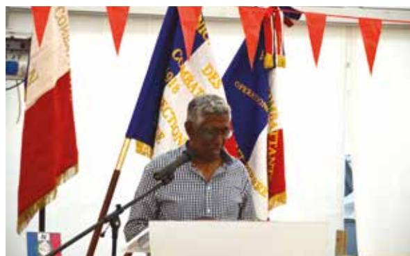
18 JUIN : COMMÉMORATION DE L'UNC