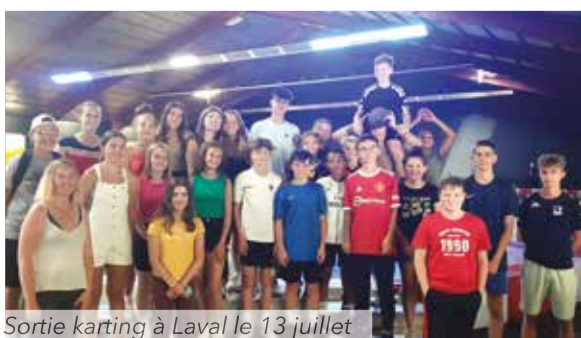
Sortie karting à Laval le 13 juillet