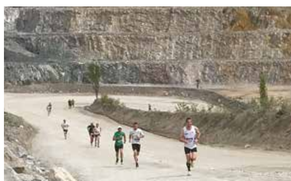
25 ET 26 JUIN : 3 E COURSE NATURE LAFARGE