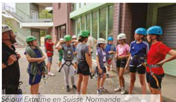
Séjour Extrême en Suisse Normande