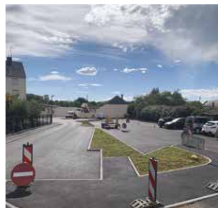
Aménagement du parking rue du Moulin