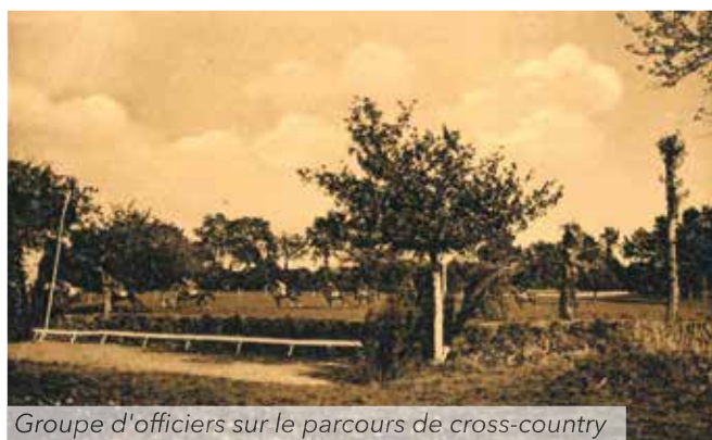
Groupe d'officiers sur le parcours de cross-country

Toujours avec un Cross-Country des Officiers à l'affiche (avec 14 partants) et cette fois-ci, avec l'heureux soutien de l'Administration des Chemins de Fer de l'Etat qui aménagea les horaires de train en provenance de Rennes et du Mans.