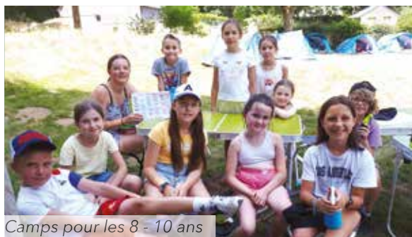
Camps pour les 8 - 10 ans