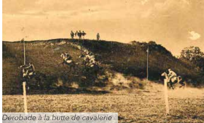
Dérobade à la butte de cavalerie

Il convient également de saluer cette longévité comme une juste récompense du formidable dévouement de nombreux bénévoles et de l'indéfectible soutien de personnalités et d'entrepreneurs locaux.