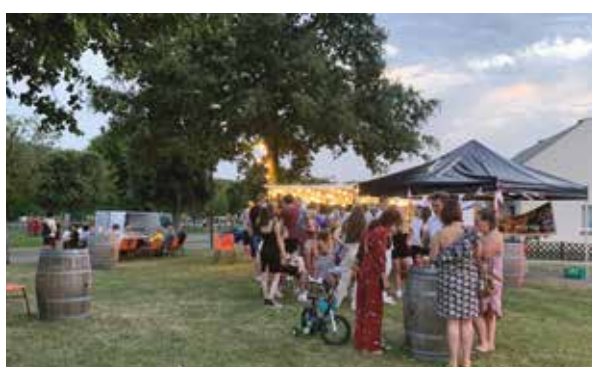
18 JUIN : FÊTE COMMUNALE