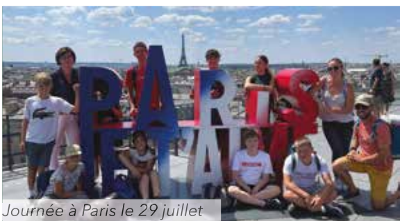
Journée à Paris le 29 juillet