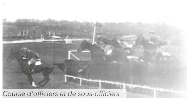
Course d'officiers et de sous-officiers