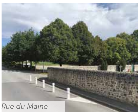
Rue du Maine