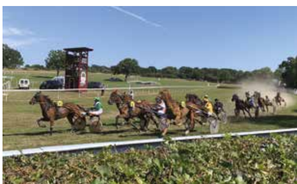
19 JUIN ET 14 JUILLET : COURSES HIPPIQUES