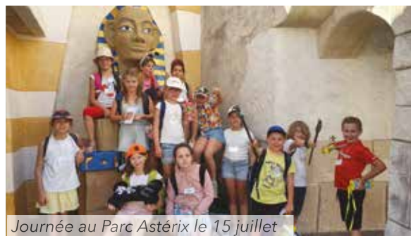
Journée au Parc Astérix le 15 juillet