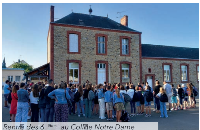
Rentrée des 6 èmes au Collège Notre Dame