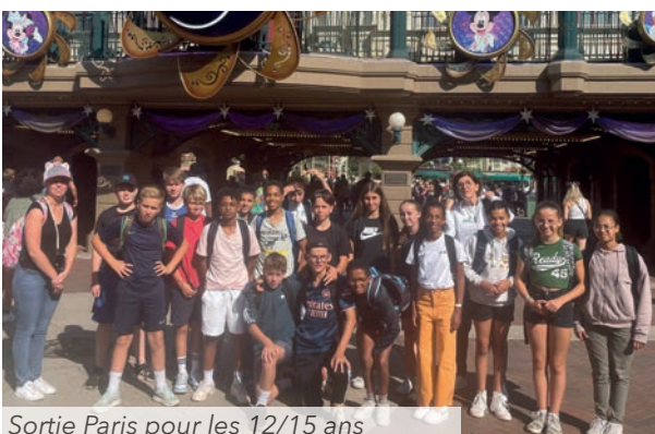
Sortie Paris pour les 12/15 ans