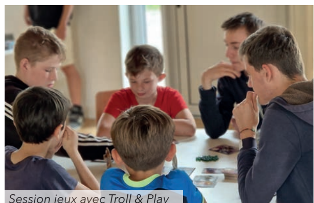
Session jeux avec Troll & Play