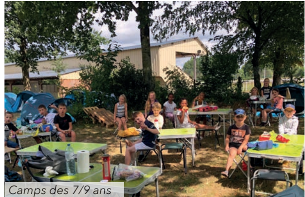
Camps des 7/9 ans