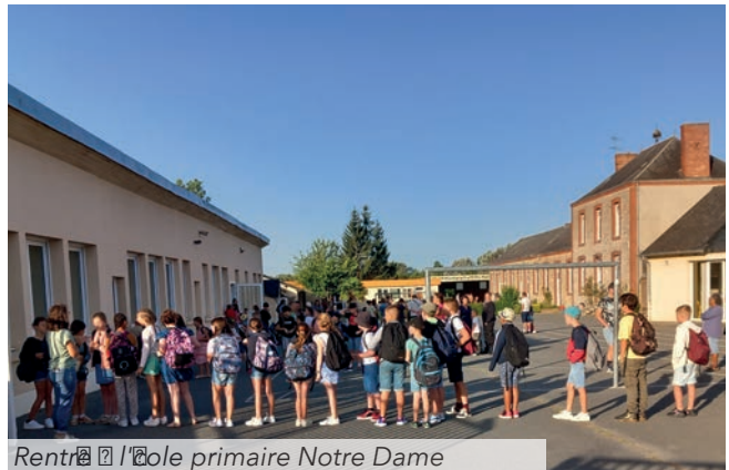
Rentrée à l'école primaire Notre Dame

élèves sont inscrits au collège Notre-Dame