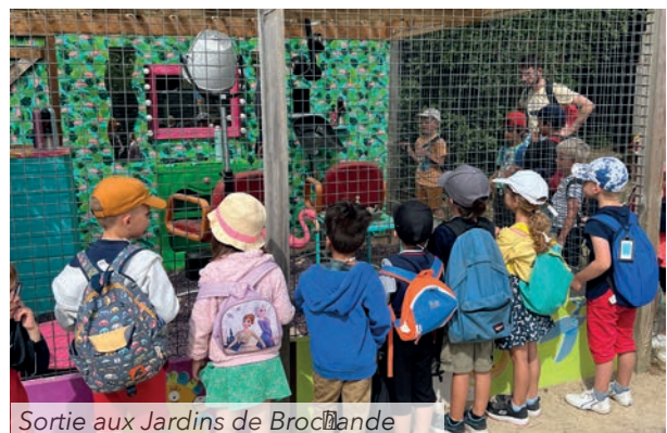
Sortie aux Jardins de Brocélande