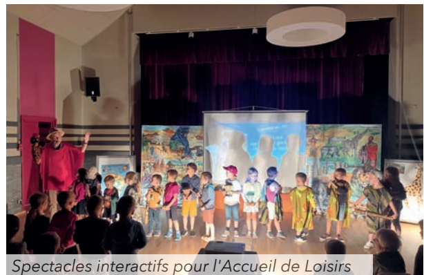
Spectacles interactifs pour l'Accueil de Loisirs