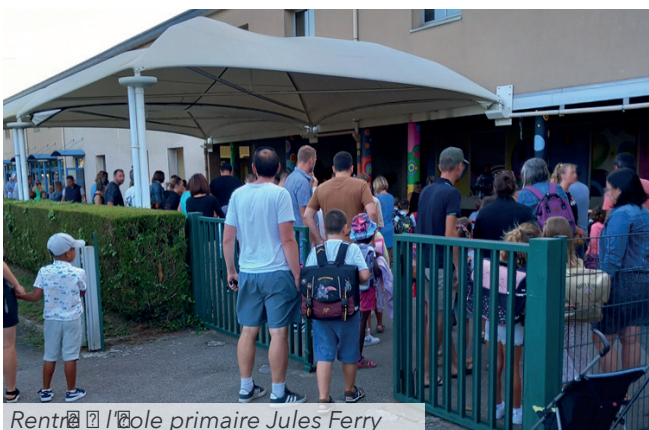
Rentrée à l'école primaire Jules Ferry